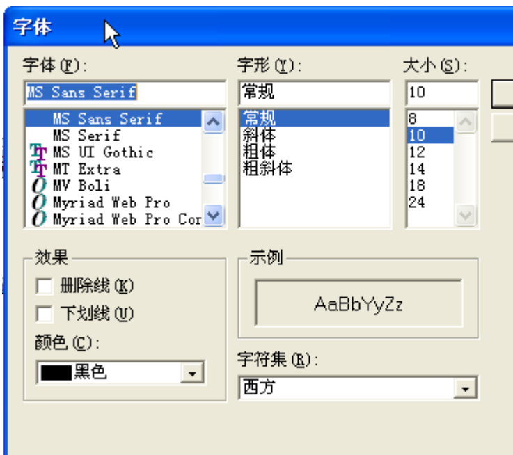
Change Font Window 視窗改變字體