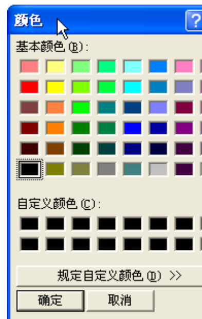
Change Color Window 視窗改變顏色